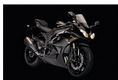
Metallic Spark Black / Flat Super Black