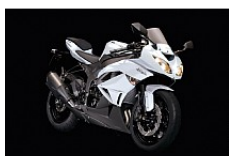
Pearl Stardust White / Flat Super Black