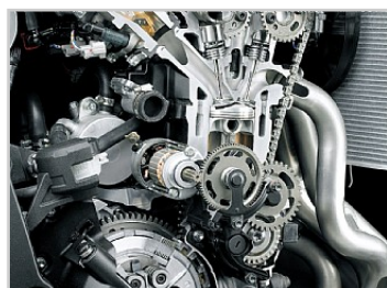
Verbeterde prestaties in het middenbereik