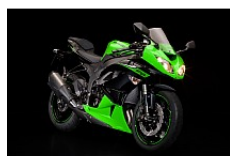
Lime Green / Metallic Spark Black