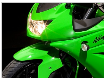
De looks van een grote motor