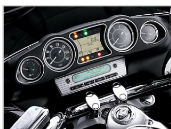
Multifunctioneel instrumentenpaneel en