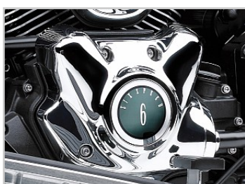
Zesversnellingsbak met overdrive